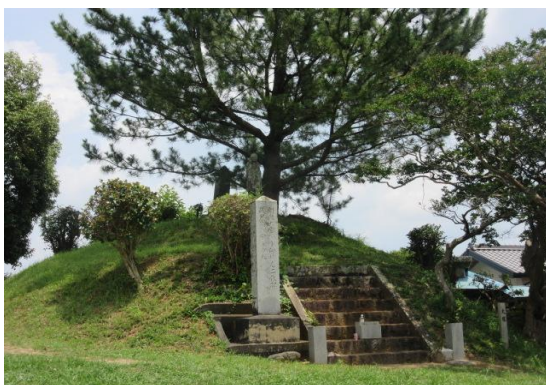
武田方の戦死者を祀る大塚

この後、設楽原歴史資料館へ移動し隣にある「信玄塚」と、戦没者の供養の行事である「火おんどり」などについて説明を受けた。その中で一番印象的であったのは、設楽原の村人たちは武田の戦死者を丁重に葬った。それが信玄塚の大塚・小塚で、大塚は武田方の戦死者を、小塚は織田・徳川軍の戦死者をお祀りしていると伝わる。その後になって武田方の人たちがここ設楽原を訪れた際、このことを知りとても感激したとガイドは説明してくれた。確かに武田に縁のある人たちにしてみれば感激することだろう、でも考えてみると 10.000 人もの死人が田畑に転がっている、それも夏にそのまま放置できるものでもなく、当時としては村人たちが亡骸を処置しなければ生活に支障が生じたはずで、やむに已まれずという面もあったと思う。