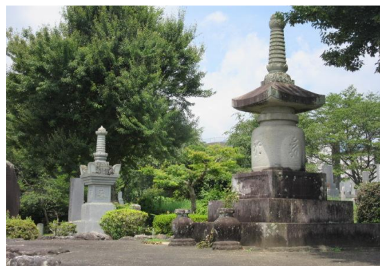
戦の 400 年後に造られた慰霊塔

その夏、この塚から蜂が群れを成して発生し、信州街道を行き来する旅人が通行できないほどになった。村人たちは、これは武田軍の戦死者の亡霊と信じ、川路勝楽寺の和尚に頼み大施餓鬼を営みその霊を慰めた。そして、夜になると盛んに松明をともして供